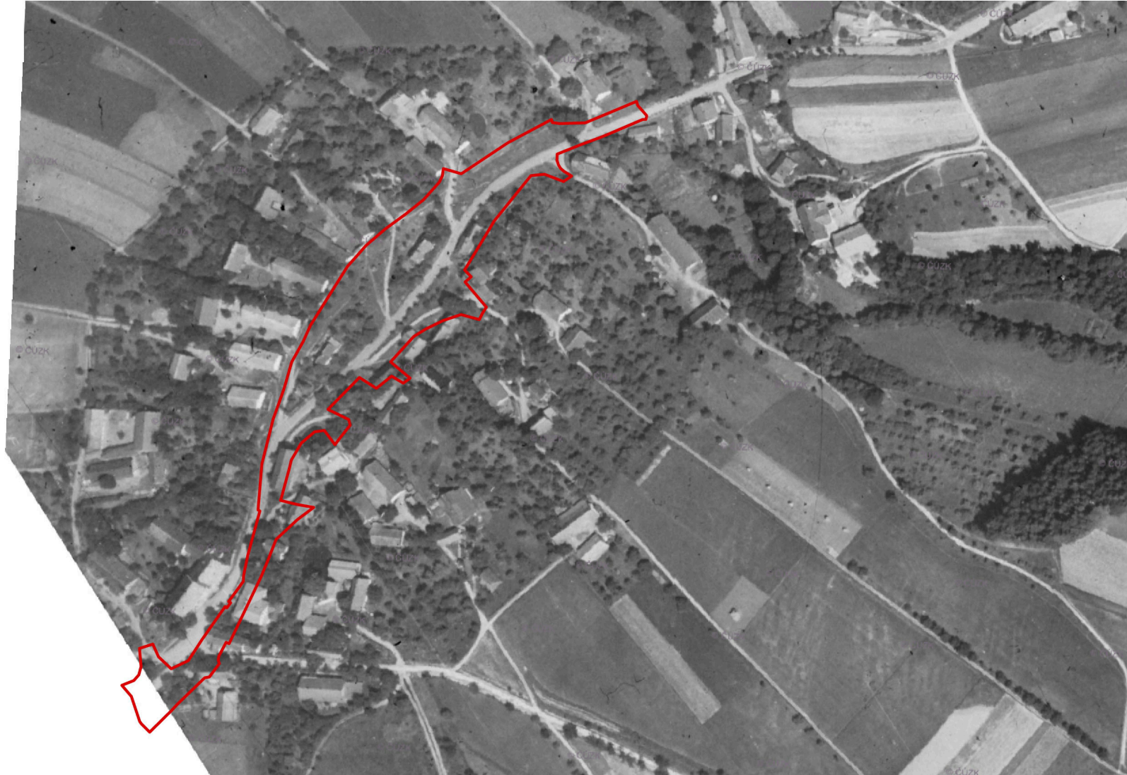
LETECKÝ SNÍMEK 1946